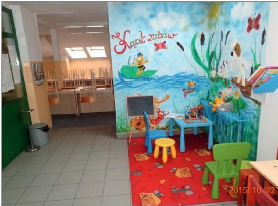
Kącik dla dzieci w sali widzeń (AŚ Suwałki)