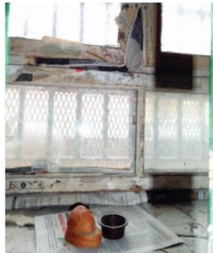
Jeden ze sposobów ochrony przed mrozem w celi mieszkalnej (AŚ Warszawa-Białołęka)