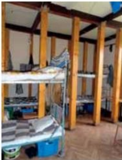
Stemple w jednej z cel mieszkalnych (ZK Jastrzębie Zdrój)