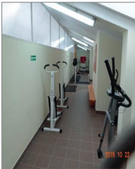
Siłownie (AŚ Suwałki)

Raport z działalności Krajowego Mechanizmu Prewencji w roku 2013