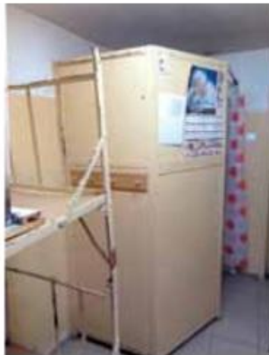
Sposób zabudowy kąjika sanitarnego (AŚ Szczytno)

Raport z działalności Krajowego Mechanizmu Prewencji w roku 2013