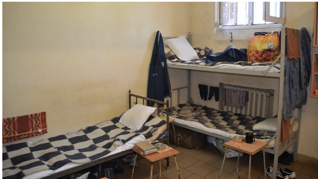
▶ Wrocław - ZK nr 1 Kleczkowska