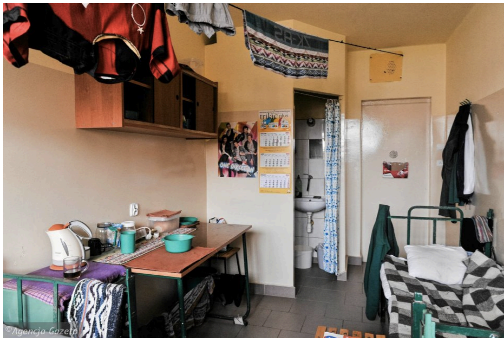
▶ Wrocław - ZK nr 1 Kleczkowska