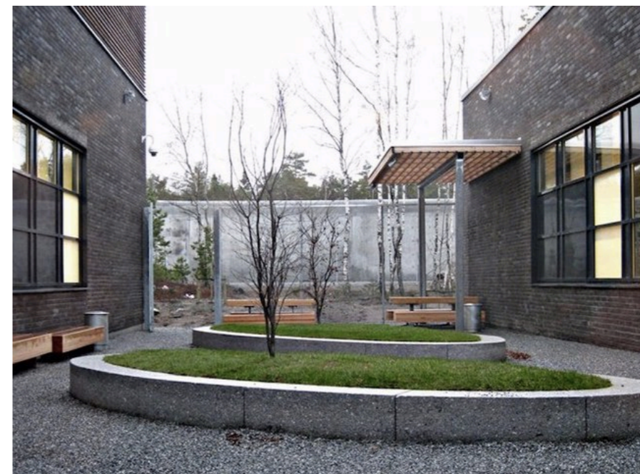
▶ Norwegia - Więzienie Halden