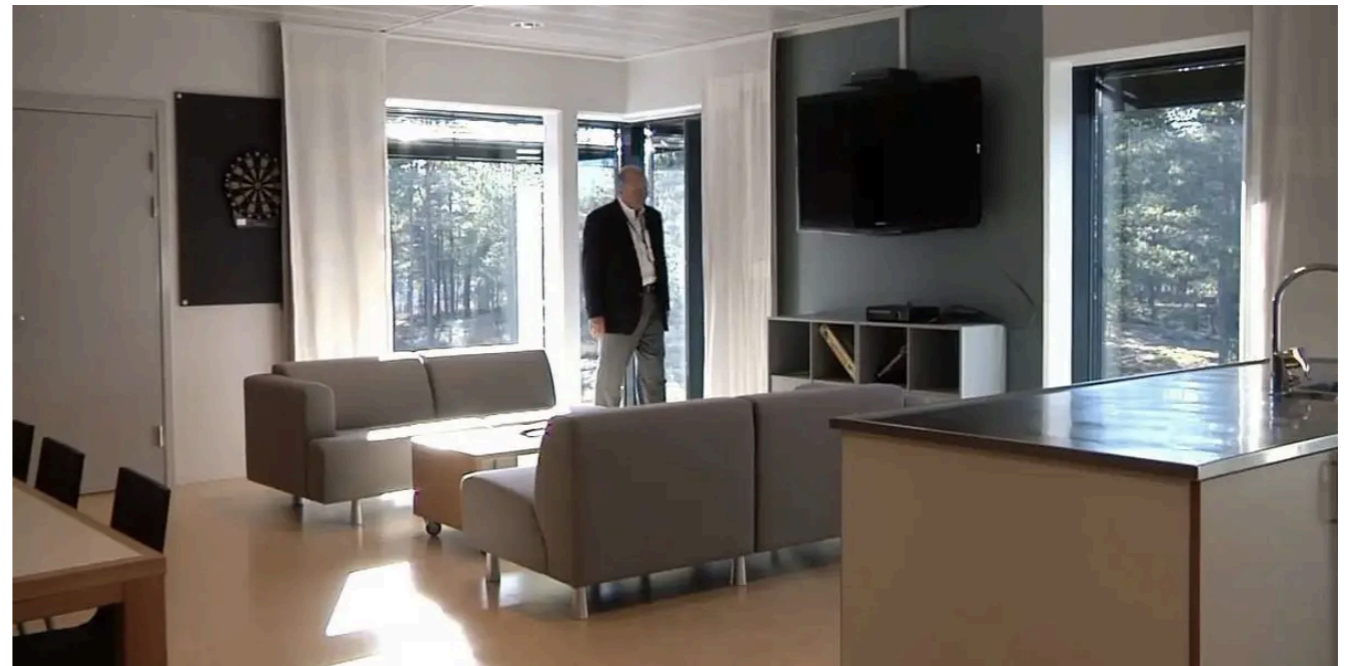
Polska cela dla skazanych niebezpiecznych