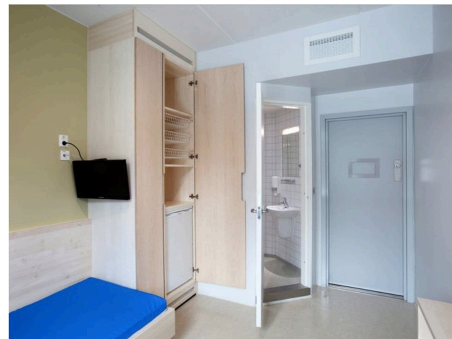
▶ Norwegia - Więzienie Halden