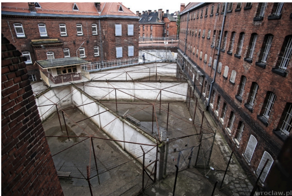
▶ Wrocław - ZK nr 1 Kleczkowska