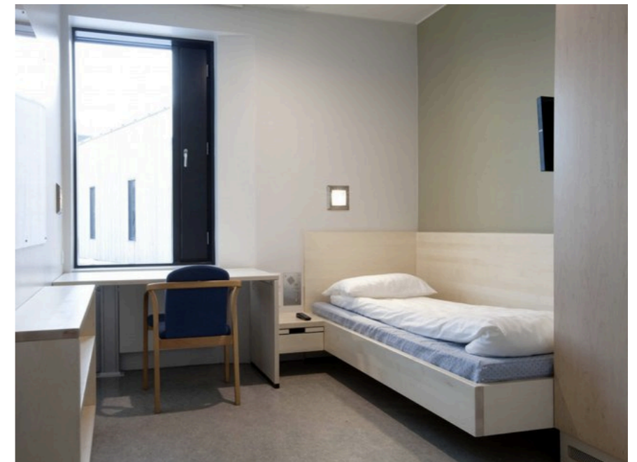
▶ Norwegia - Więzienie Halden