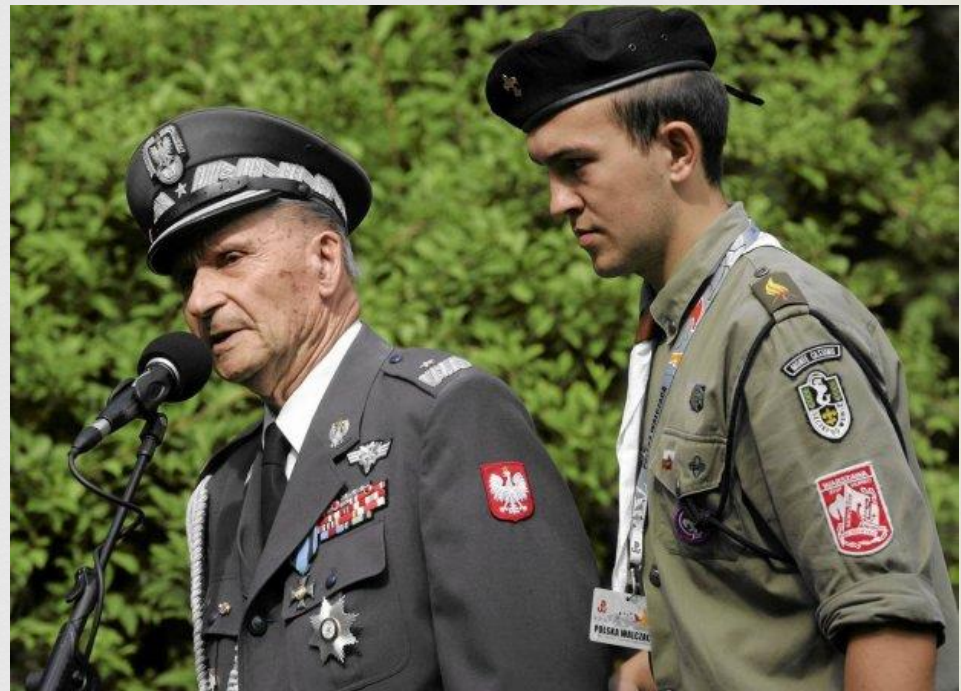
☞ Gen. Bryg. Zbigniew Ścibor-Rylski